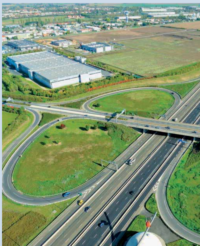
L'autoroute A5a dessert directement le parc.

Dédié aux activités technologiques, tertiaires et industrielles, le parc accueille des entreprises qui souhaitent s'installer dans des programmes modernes, ou faire construire leurs locaux. Sa proximité immédiate de Carré Sénart permet aux salariés d'accéder à de nombreux services.